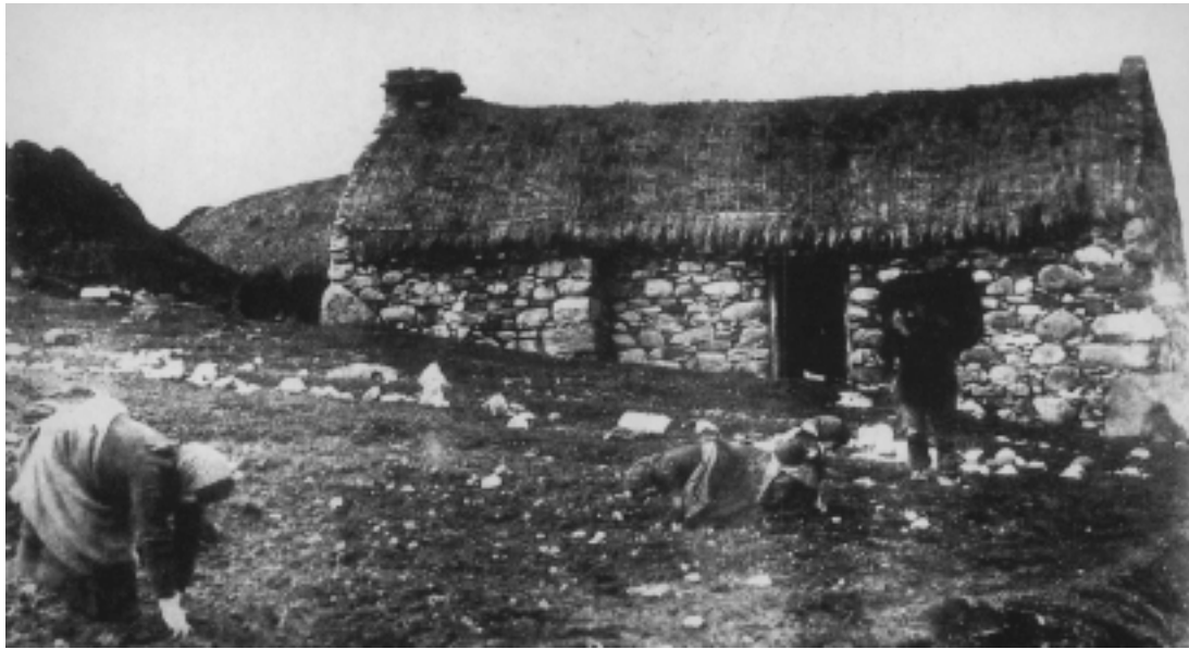
Áitreabh Bóithigh c.1880. Gaoth Dobhair, Co Dhún na nGall