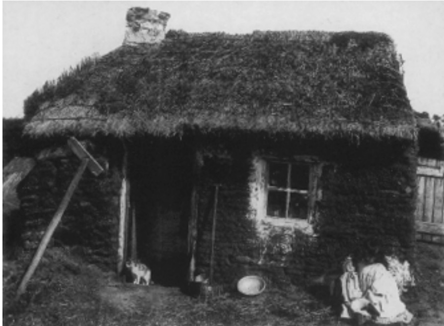
Teach Fód gar do Dhroichead Thuama, Co Aontroma